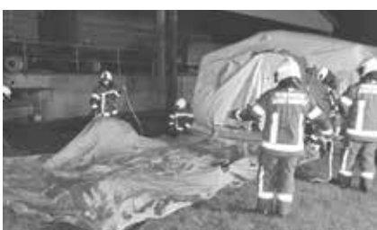
| Diese im Aufbau befindlichen Zelte wurden für die Dekontaminierung und den Aufenthalt der Geschädigten benötigt.

Nesselal | 112 Einsatzkräfte aus der Feuerwehr und der Katastrophenschutzzüge haben am Abend des 2. November gemeinsam den Ernstfall geprobt und das mit Erfolg.