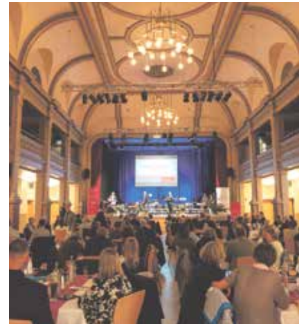
| Die Gothaer Stadthalle war zur Gala gut gefüllt.