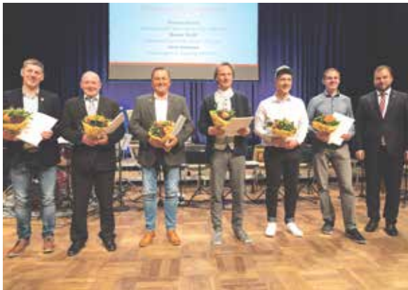
| Für ihr Engagement in der fünften Jahreszeit sind sechs Akteure aus Karnevalsvereinen mit Ehrenamtskarten ausgezeichnet worden.