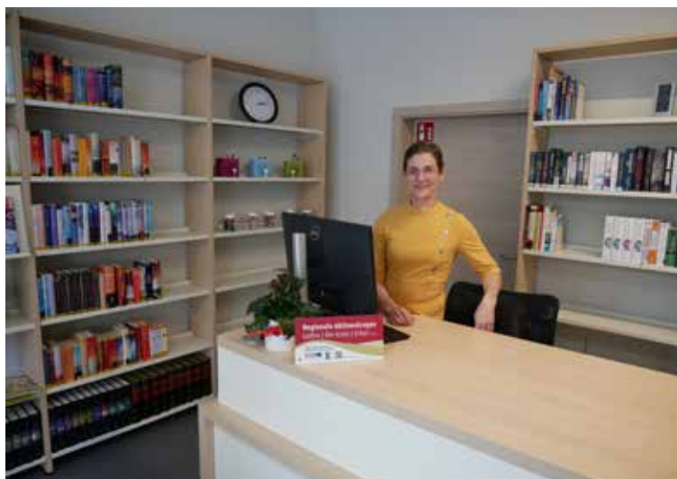
| Die Stadt Friedrichroda modernisierte mit Unterstützung der LEADER-Förderung die Innenausstattung ihrer Stadt- und Kurbibliothek