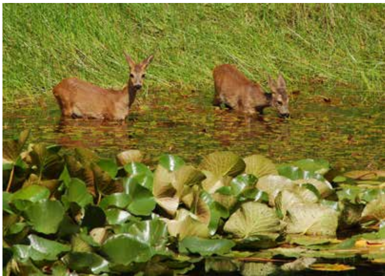
| Wird die Sommerhitze zu stark, gehen Rehe auch mal ins Freibad.

Erfurt | Im Gegensatz zu Menschen oder Pferden schwitzen Wildtiere bei der Bewegung nicht oder kaum – viele wilde Gesellen haben wenig oder gar keine Schweißdrüsen.