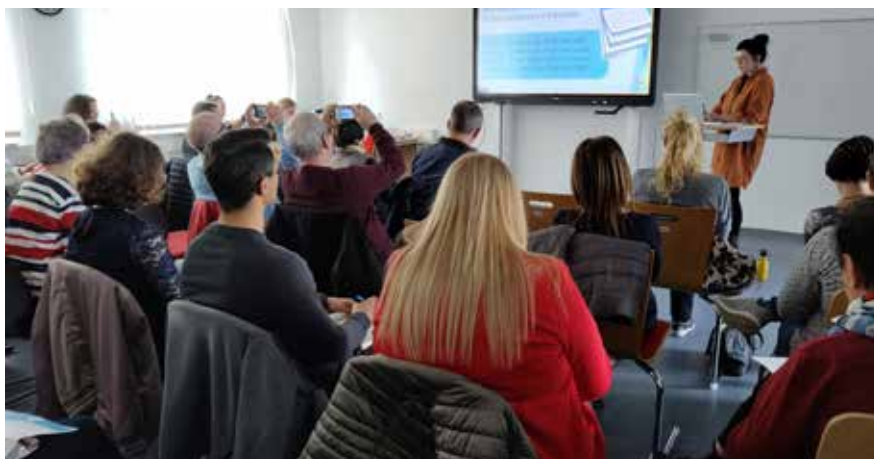
| 39 Haupt- und Ehrenamtliche haben sich über das Projekt informiert.