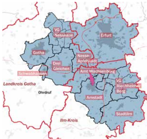
| Städte und Gemeinden des Projektgebiets.

Landkreis I Der Landkreis Gotha, der Ilm-Kreis und die Landeshauptstadt Erfurt erstellen im Zeitraum 2022/23 eine „Siedlungsflächenkonzeption Erfurter Kreuz“. Das Konzept befasst sich mit der zu erwartenden Einwohner-, Arbeitsmarkt- und Wohnentwicklung bis zum Jahr 2035.