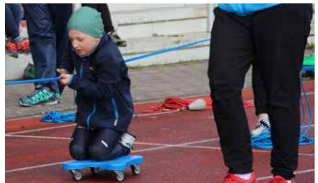
| Neben Disziplinen wie Rennen, Werfen und Balancieren haben sich die Kindergartenkinder zum Beispiel auch auf Rollbrettern so schnell es geht an einem gespannten Seil entlang gezogen.

Vielen Dank an die vielen Helferinnen und Helfern für die großartige Organisation und an die Regionalstiftung der Kreissparkasse Gotha als Sponsor.