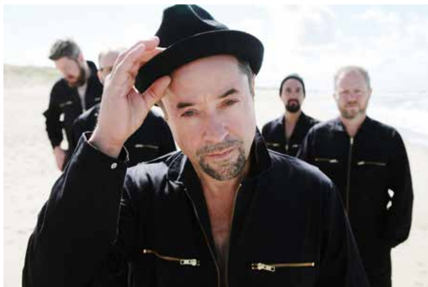
| Der Schauspieler und Sänger an Josef Liefers gehört zu den Stars, die Gotha zum Friedenstein Open Air 2023 ihre Aufwartung machen.