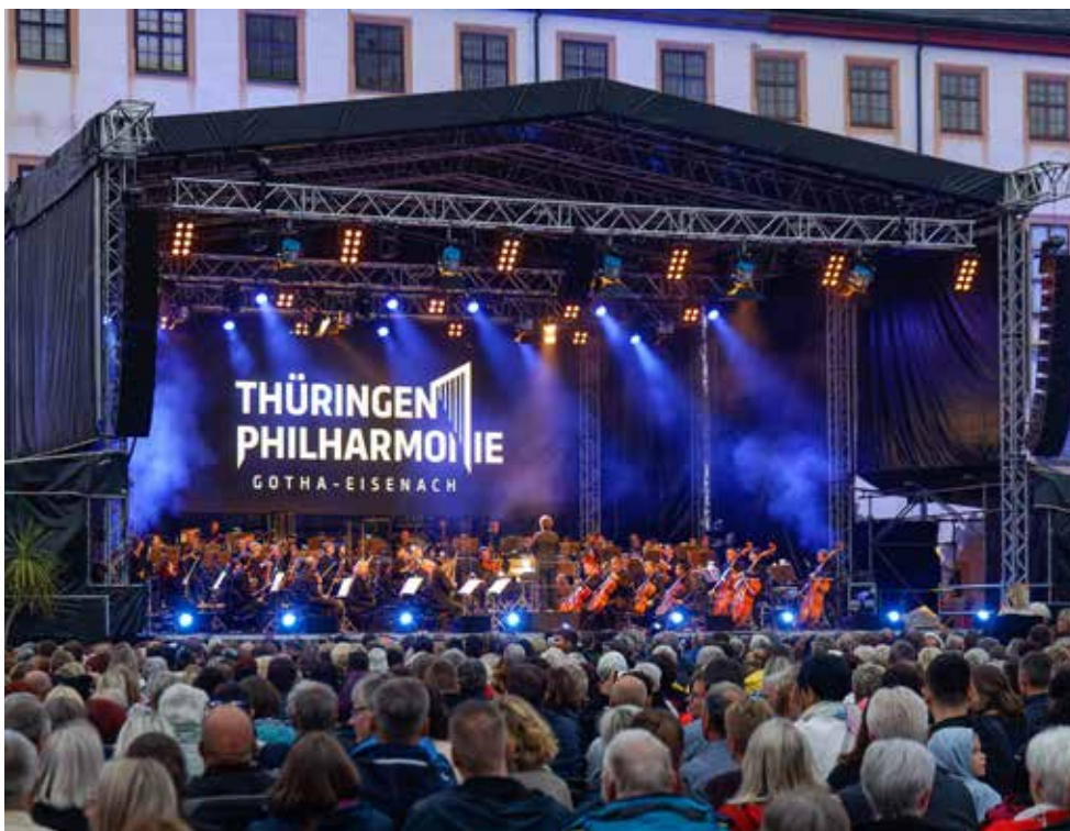
| Auch in diesem Jahr wird die Thüringen Philharmonie Gotha-Eisenach wieder viele Besucher zum Friedenstein Open Air auf den Hof von Schloss Friedenstein ziehen.

Highlight in diesem Jahr: das erst 2022 etablierte Konzertformat „Thüringen Philharmonie trifft ...“. Die erfolgreiche Premiere im letzten Jahr spielte die Thüringen Philharmonie mit Tim Bendzko. Am 2. Juli 2023 begrüßen wir den nächsten großen Pop-Künstler zum gemeinsamen Konzert auf der Bühne im Hof von Schloss Friedenstein: MILOW. Alle Titel des Programms werden für großes Orchester neu arrangiert. 2023