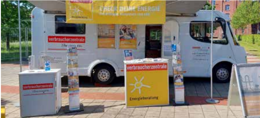
| Das Infomobil der Verbraucherzentrale Thüringen kommt nach Waltershausen und Ohrdruf.

Die Beratung ist kostenfrei. Die Energieberatung der Verbraucherzentrale wird gefördert vom Bundesministerium für Wirtschaft und Energie. Dank einer Kooperation mit dem Thüringer Umweltministerium und der Landesenergieagentur THEGA sind die Beratungen in Thüringen kostenfrei.