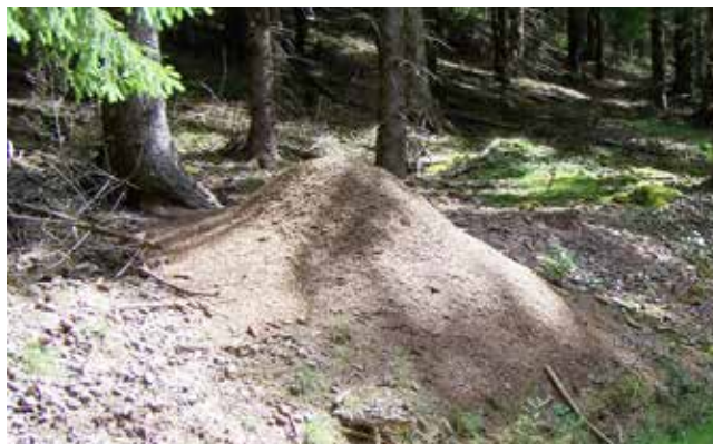
| Mögen untersonnte Waldränder für ihre imposanten Bauwerke: so in der Waldameisen. Thüringens Forstleute schützen und fördern die Nestumgebung auf bis zu einem Hektar wirkungsvoll reduziert werden.

Die unterirdische Nestbautätigkeit der Waldameisen führt zu einer physikalischen, chemischen und biologischen Verbesserung des Bodens. Die Erde wird von den emsigen Krabbeltieren durchwühlt, durchmischt und mit Nährstoffen angereichert. Die für das Baumwachstum ungünstige Bodenversauerung wird vermindert, die Krümelstruktur lässt mehr Sauerstoff in den