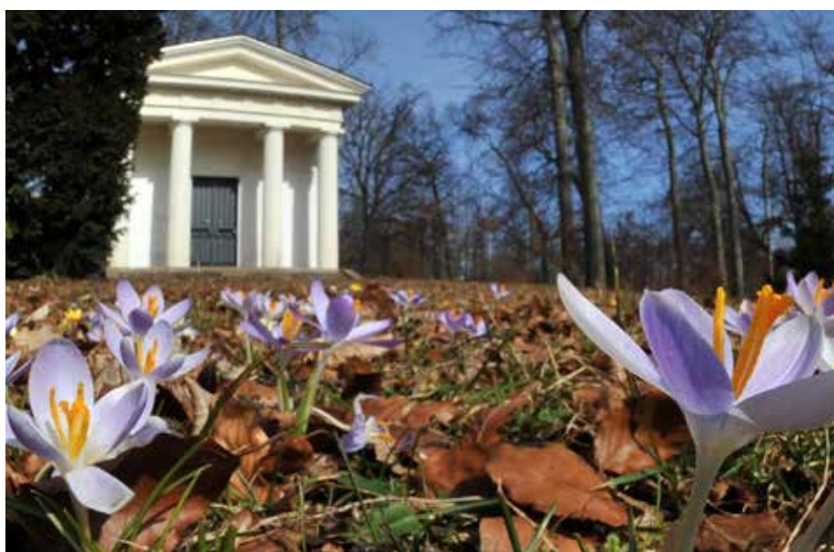
| Blick in den frühlinghaften Gothaer Park.