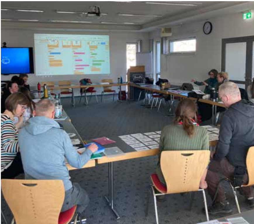
| Zur „Multiplikatoren-schulung Kindermedienschutzparcours“ trafen sich vor kurzen Schulsozialarbeiter:innen und Jugendarbeiter:innen des Landkreises Gotha.

Landkreis I Die Lebenswelten junger Menschen gestalten sich zu einem großen Teil digital. Medienkompetenz ist in unserer digitalen Informationsgesellschaft eine Kulturtechnik – wie Lesen, Schreiben und Rechnen. Somit gehört Medienbildung heute zur unverzichtbaren Aufgabe sowohl in Schule als auch in der Offenen Kinder- und Jugendarbeit.