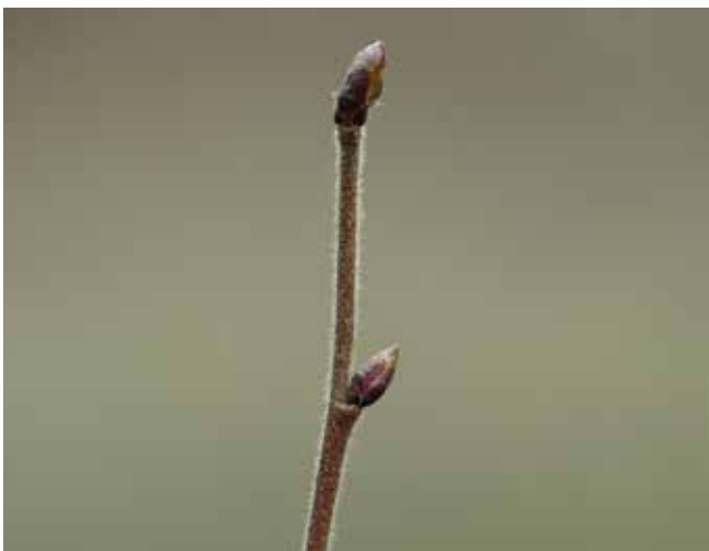
| Fasziniert schon wegen ihrer Schlichtheit und Eleganz: Die Knospe der Moorbirke, Baum des Jahres 2023

So lässt sich mit geringem Aufwand insbesondere Kindern und Jugendlichen ein faszinierender Aspekt der natürlichen Lebensvorgänge vor Augen führen. Beeindruckende Naturmomente - auch ohne Display oder Bildschirm.