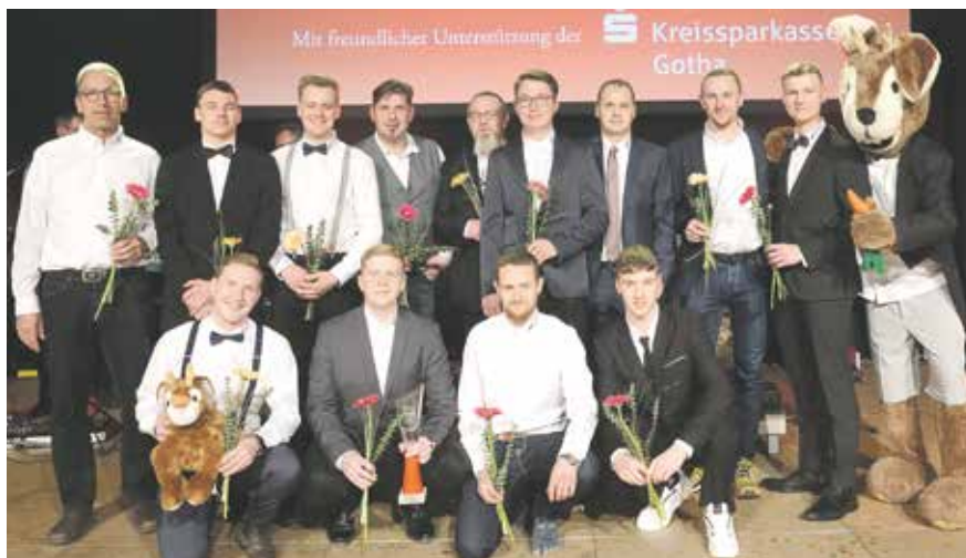
| Die Ice Rebels aus Waltershausen belegten bei den Teams den 3. Platz.

Die Veranstaltung wurde von der Kreissparkasse Gotha und der Regionalstiftung der Kreissparkasse Gotha gefördert.